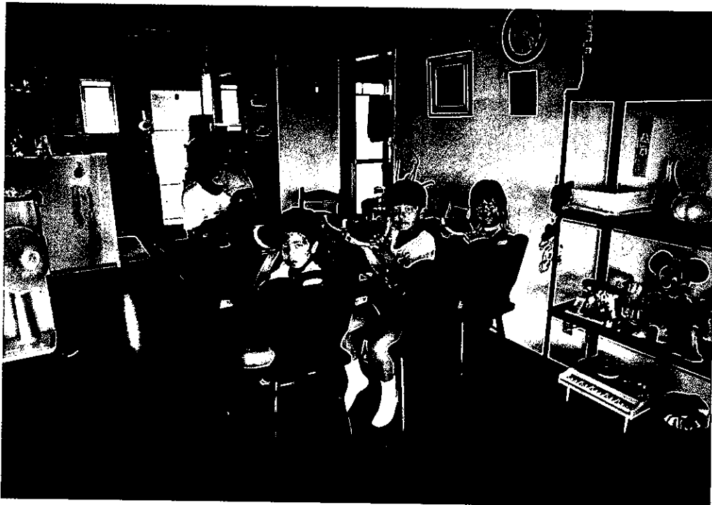
「石川第2団地・石川市」